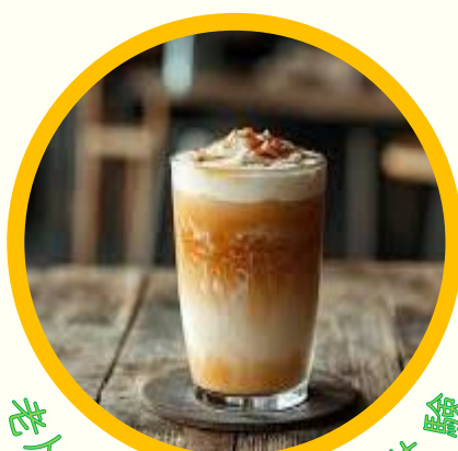
特別ホームでCafe体験