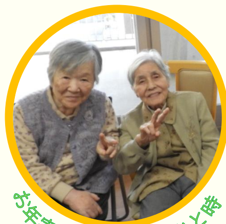
お年寄りとの楽しいひと時

高校生の皆さんと介護福祉学科学生が一緒になって、おじいちゃん・おばあちゃんに笑顔になってもらう企画です。